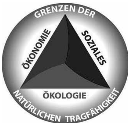
Abb. 1: Zur Veranschaulichung dieser Definition wird das Zieldreieck der Nachhaltigkeit in den Grenzen der natürlichen Tragfähigkeit verwendet.